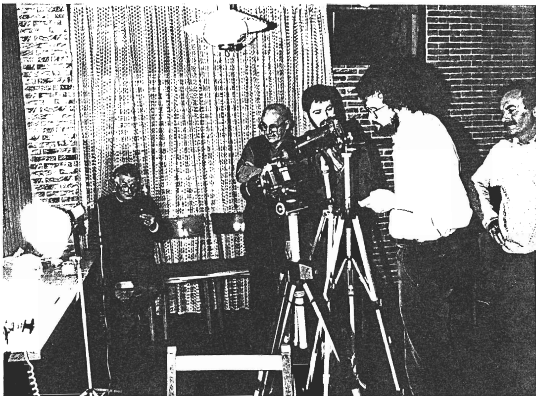
Einige unserer Mitglieder "in ägtschen".